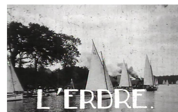
La Plus belle rivière de France : l'Erdre - 1927