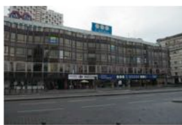
Emplacement supposé de l'ancienne Caserne du Colombier, rue d'Isly.