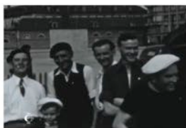
En fond, bâtiment supposé de la Caserne du Colombier (rue d'Isly).

Le 4 février, l'atelier Transmédia "Il était, il est... une fois Rennes" sera accueilli sur le festival Travelling pour une présentation unique au public du travail des étudiants. À partir des images d'amateurs tournées entre les années 1930 et fin 1970, des étudiants ont découvert des quartiers de Rennes, les ont retrouvés à l'occasion d'un jeu de piste grandeur nature. Ces quartiers sont devenus le décor, le sujet, l'acteur... des films qu'ils réalisent. Ce projet collaboratif est partagé en ligne ( http://iletaitlestunefoisrennes.info/ ) et vous retrouverez ces nouvelles créations grâce à des QR codes in-situ à partir du mois d'avril 2015.