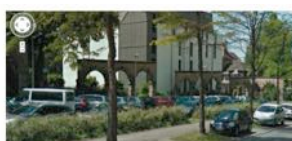
Photos bonus : les Arcades « remontées » Boulevard Mounier. (capture écran Maps)