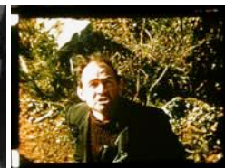
Le Christ en bois

Festival Clito'rik - Du 3 au 5 avril 2015 - MJC de Trégunc (29)