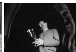
Mon mari est un Saint