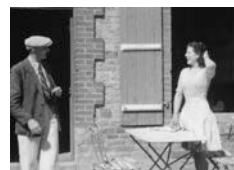
V'là l'minis' !