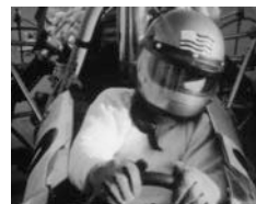
Au royaume de la réussite