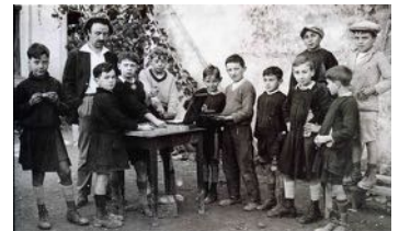
Élèves de Saint-Loup et Célestin Freinet

La réalisatrice a utilisé des images issues du film « L'école des roches » de Camille Fraysse.