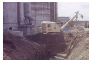
Usine de Montoir (1962)