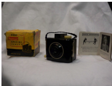
Kodak Baby Brownie