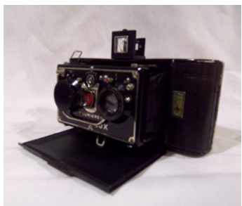
Appareil photo stéréoscopique