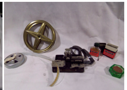
Colleuse Kodak 8-16 mm