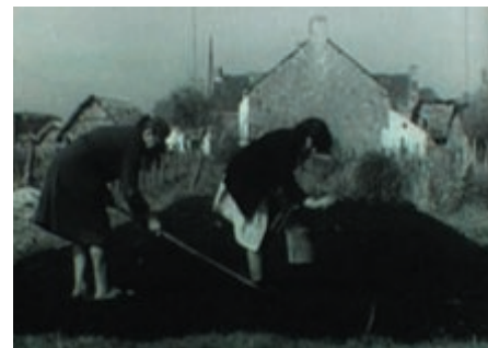
Brière et Briérons

En 1947, la Brière est à une époque charnière de son histoire. Depuis plusieurs décennies déjà, les habitants des îles briéronnes travaillent dans les industries de la région de Saint-Nazaire, et notamment aux chantiers de construction navale. Ce film d'époque en noir et blanc relate la dualité de la vie briéronne, dont le tortillard, petit train assurant le transport des ouvriers qui allaient modifier les Liberty Ship, constitue le trait d'union.