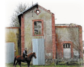
Gare de Guiscriff avant sa réhabilitation

Tout au long du parcours muséographique, les visiteurs pourront s'immerger dans l'ambiance révolue des gares, du transport et des voyages ferroviaires sur le réseau Breton. Pour cette remontée dans le temps, le dispositif scénographique utilise un grand nombre d'images d'archives dont plus de vingt deux minutes de films issues des collections de la Cinémathèque de Bretagne.